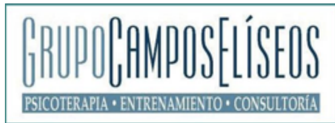
Campos Eliseos, México