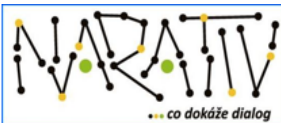
Narativ, República Checa